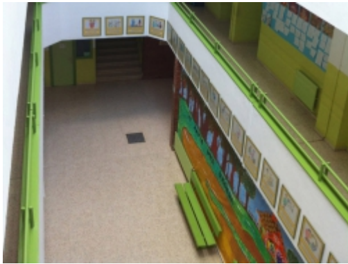
Vestíbul de l'edifici principal