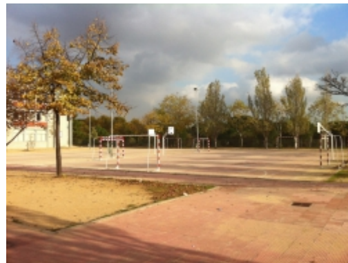
Pati de Primària