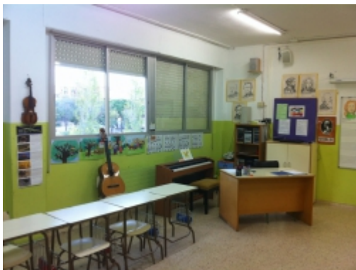
Aula de música