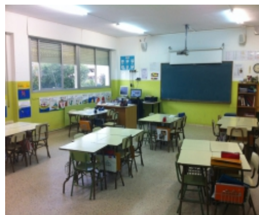
Aules de primària