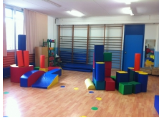
Aula de psicomotricitat

Espais exteriors d'esbarjo amb dos pistes poliesportives (pati d'educació primària). Espai exterior al costat de l'edifici petit amb diferents instal·lacions i un sorral per als alumnes d'Educació Infantil.