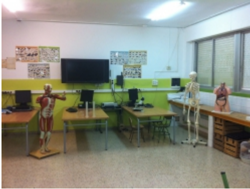
Aula de ciències