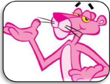
La Pantera Rosa!