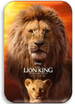
El Rei Lleó